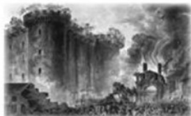
La fête nationale