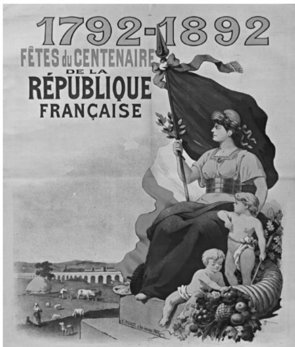
E. Pichot, affiche, 1892.

La République a mis plus de 100 ans pour s'installer en France. Différents régimes politiques vont se succéder ( monarchies, empires, républiques ). C'est avec la IIIème République que la séparation des pouvoirs (exécutif, législatif et judiciaire) est assurée durablement.